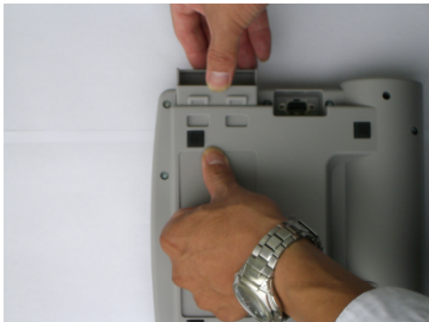
③電池ケースのノッチを押してふたをあける。