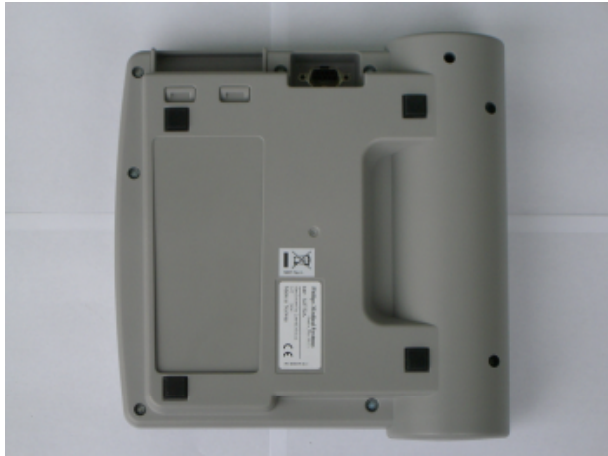
①左上の方に電池取り出しのノッチがある。